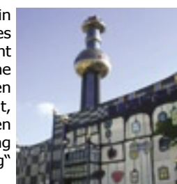
Bild der MVA Spittelau

Weiters stellt die Anlage ein weltweit einzigartiges, spektakuläres Kunstwerk (siehe Bild), das nicht nur ein gelungenes Beispiel für eine harmonische Symbiose zwischen Technik, Ökologie und Kunst darstellt, sondern darüber hinaus einen immensen Beitrag zur Verringerung der „optischen Umweltverschmutzung“ im städtischen Lebensraum leistet.