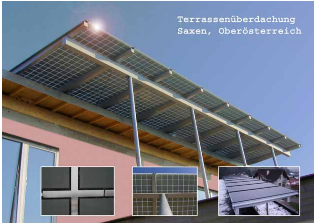
Abbildung 7: Terrassenüberdachung, Saxen, OÖ