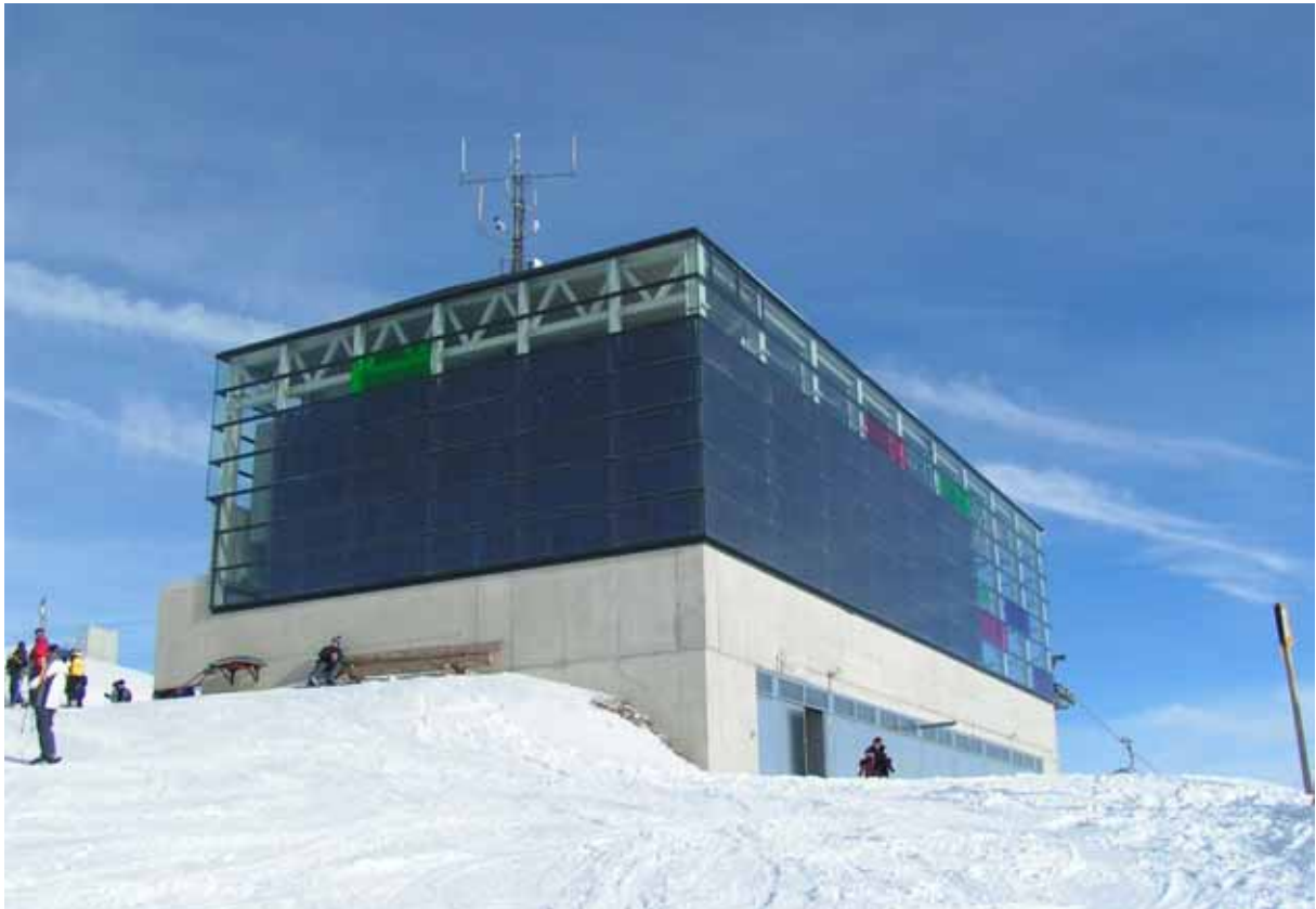
Abbildung 6: Liftstation Kriegerhorn, Österreich

Zusatzkosten darzustellen, da mit den PV-Modulen herkömmliche Fassadenelemente ersetzt werden können.