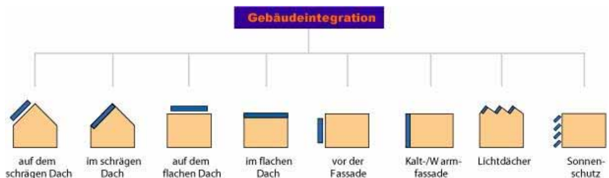
Abbildung 2: Möglichkeiten der Gebäudeintegration

Abbildung 2 gibt einen Überblick über verschiedene Integrationsmöglichkeiten von Photovoltaik in Gebäuden.