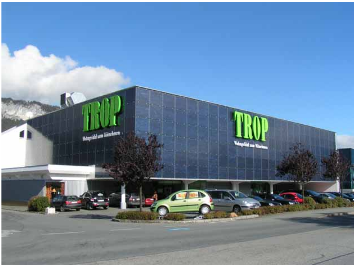
Abbildung 5: Bild Firma Trop, Österreich

Daraus ergibt sich, dass hauptsächlich nur mehrschalige Wandkonstruktionen mit einer hinterlüfteten Außenwandverkleidung aus vorgehängten modularen und austauschbaren Elementen verwendbar sind. Die Elemente müssen die Schutzfunktionen der Außenschicht, wie z.B. Witterungsschutz übernehmen. Materialien für Außenwände, welche sich für die Integration mit PV Zellen eignen sind Ziegel, Faserzement, Natursteine, Metalle, Glas, Kunststoffe, wenn diese hinterlüftet und über eine Metallunterkonstruktion und Halterungsklammern befestigt sind.