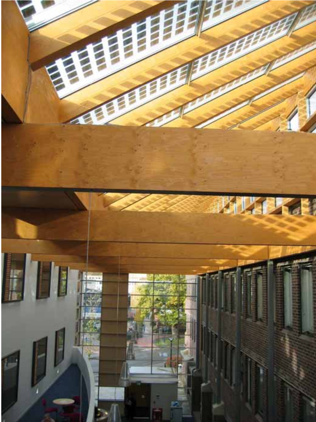
Abbildung 4: Oberlichte Universität Southampton, Großbritannien