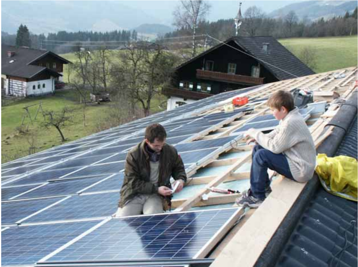
Abbildung 3: Montage Schägdach – PV - Anlage, Österreich