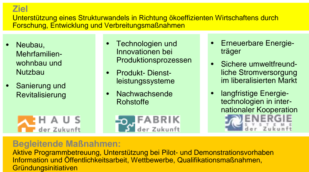
Abb.2: Impulsprogramm „Nachhaltig Wirtschaften“

Im Impulsprogramms laufen zwei Programmlinien (siehe Abbildung 2) zu den Themen "Haus der Zukunft" (seit Juni 1999) und "Fabrik der Zukunft" (seit Oktober 2000). Die dritte Programmlinie "Energiesysteme der Zukunft" wird vorbereitet (erste Ausschreibung für Ende 2002 geplant).