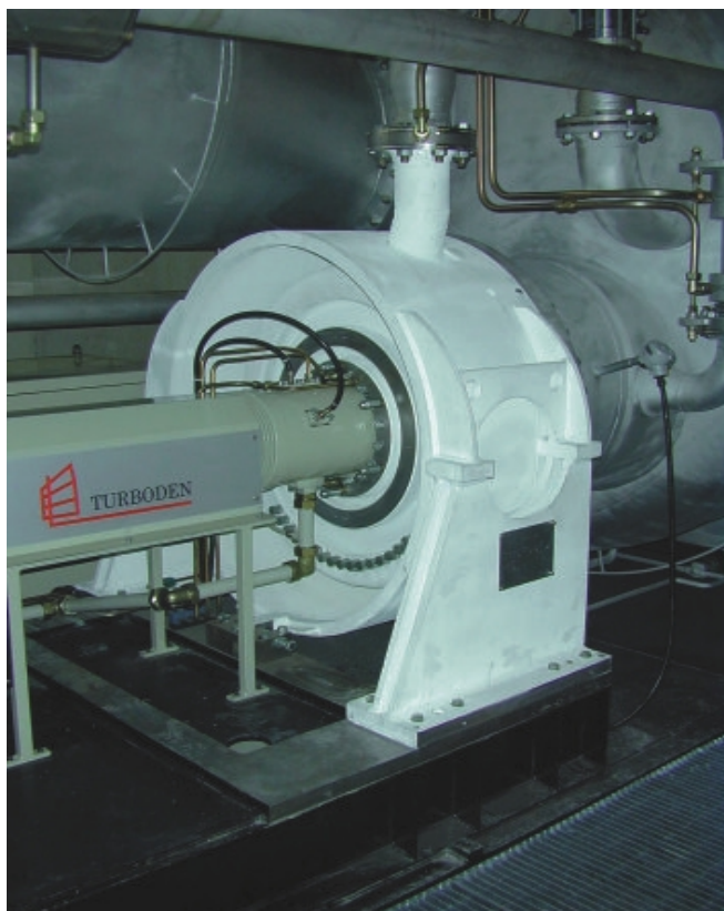
Abbildung 3: Die Turbine der ORC-Anlage in Admont ist eine zweistufige Achsialturbine mit direkt getriebenen Generator. Als organisches Arbeitsmittel wird Silikonöl eingesetzt.

Der elektrische Wirkungsgrad der ORC-Anlage in der Holzindustrie STIA, Admont, liegt bei 17,7% (erzeugte Nettostrommenge / dem ORC-Kreislauf zugeführte Wärme). Als organisches Arbeitsmittel wird Silikonöl in einem geschlossenen Kreislauf eingesetzt. Dieses Öl ist nicht toxisch und auch kein Treibhausgas.