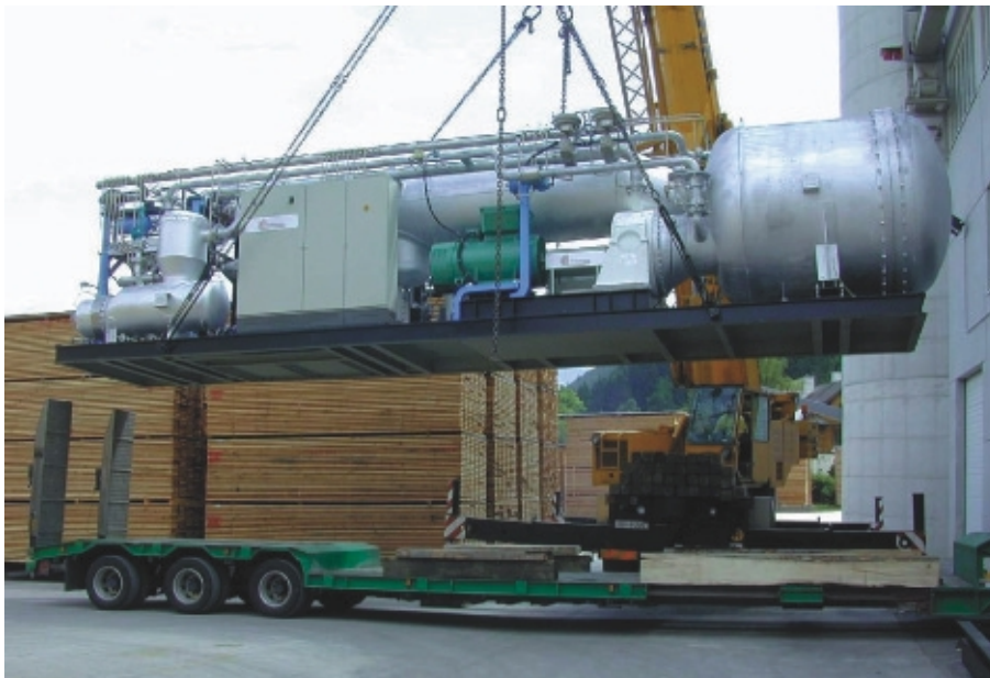
Abbildung 2 Bei der STIA im steirischen Admont wurde eine auf einem Containerrahmen vormontierte ORC-Anlage installiert. Die Anlage hat eine elektrische Nennleistung von 400 kW und ist seit September 1999 in Betrieb.

Herzstück der Biomasse-KWK auf ORC-Basis ist der auch bei den Dampfprozessen verwendete Rankine-Prozess. Beim Organic Rankine Cycle (ORC) wird anstelle von Wasser ein organischen Arbeitsfluid eingesetzt. Mit diesem Prozess ist es möglich, aus Wärmeenergie auf niedrigem Temperaturniveau elektrische Energie zu erzeugen. Durch die Wahl eines